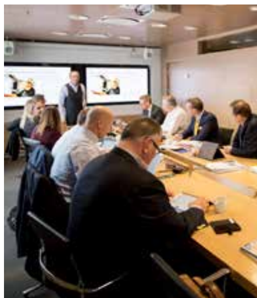
Styrelsen diskuterar den senaste utvecklingen inom hälsa och säkerhet.